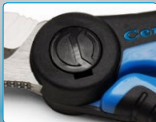
Perno anti allentamento