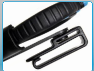
Custodia con aggancio girevole